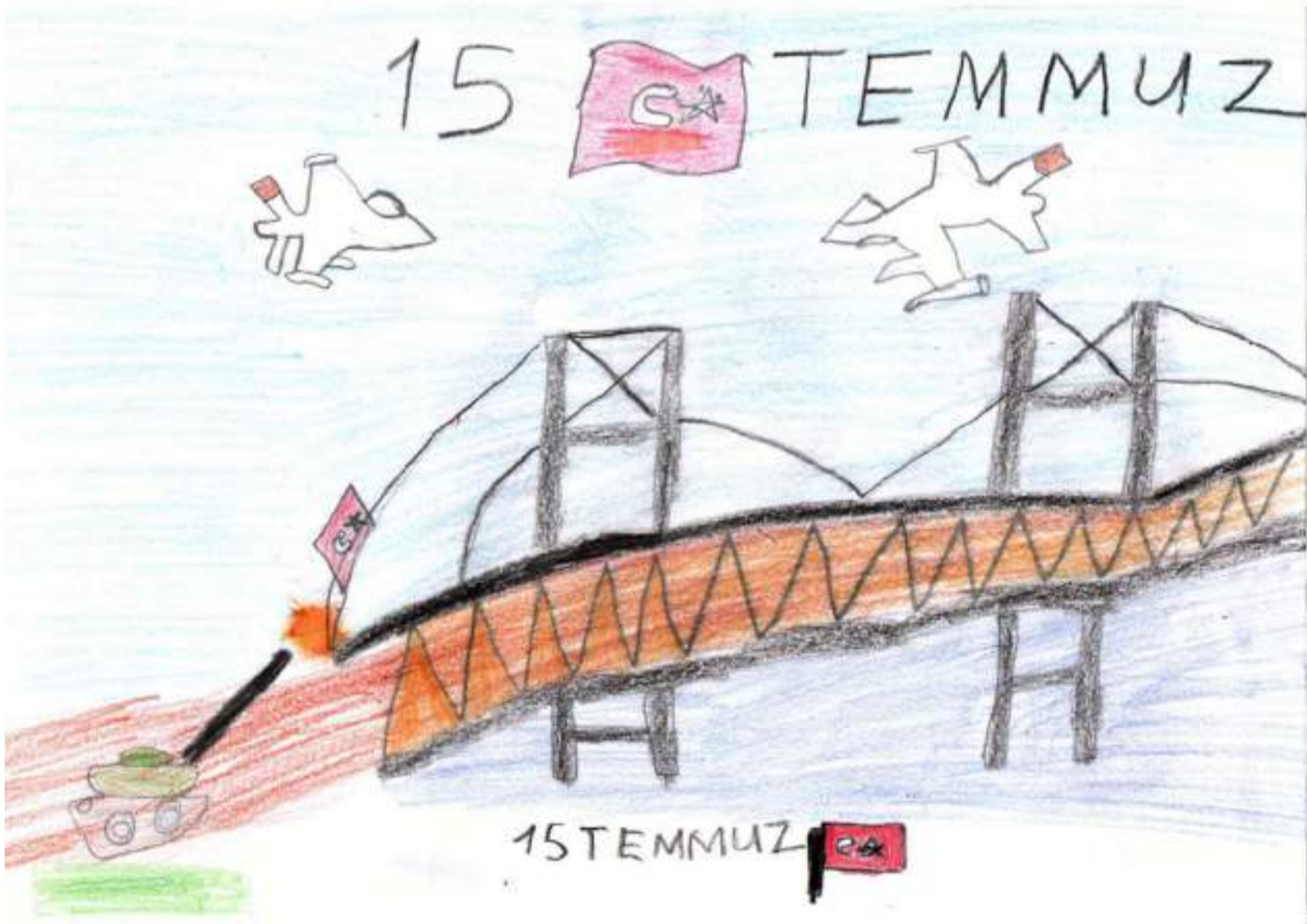
Elif Miray ERKILIÇ / 2-D Sınıfı