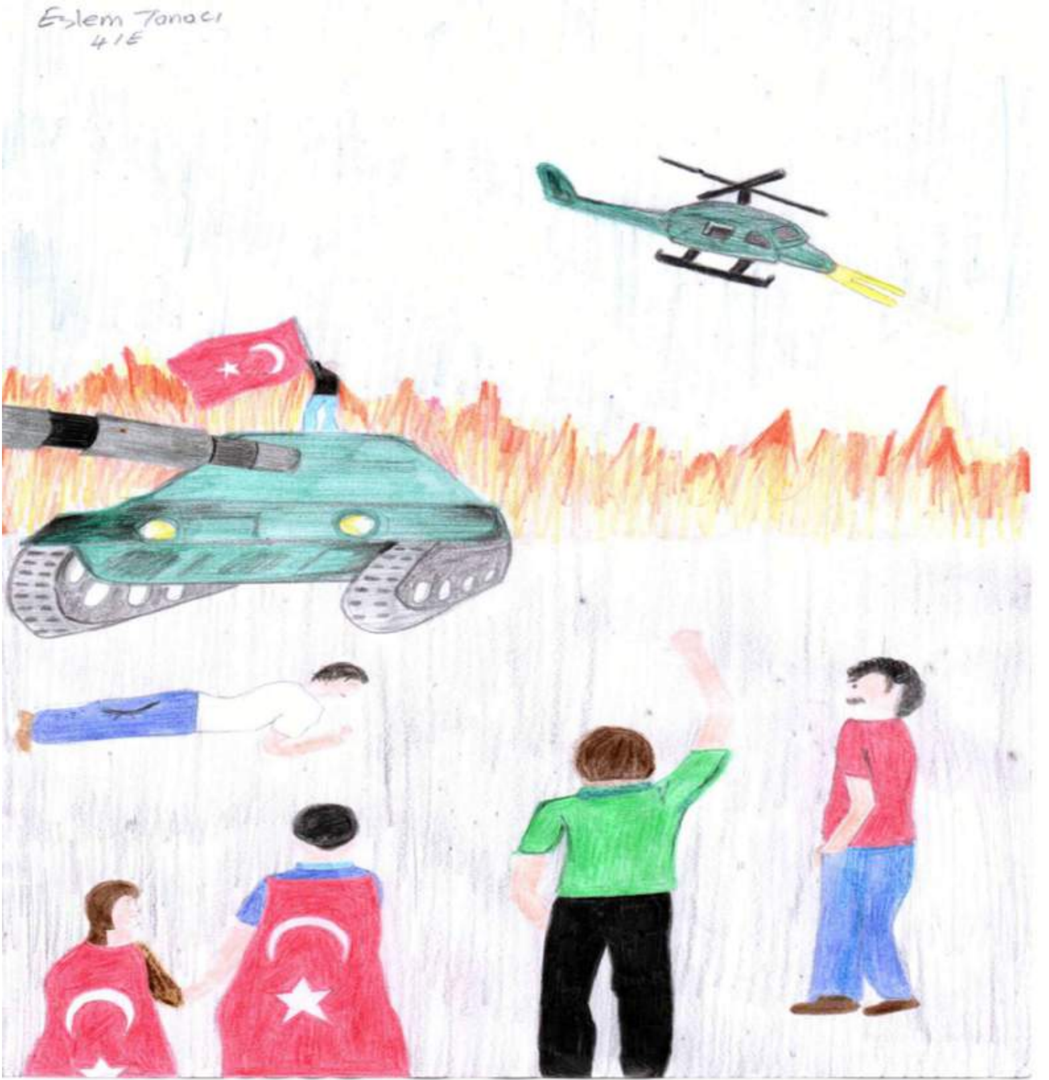
Eslem TANACI / 4-E Sınıfı