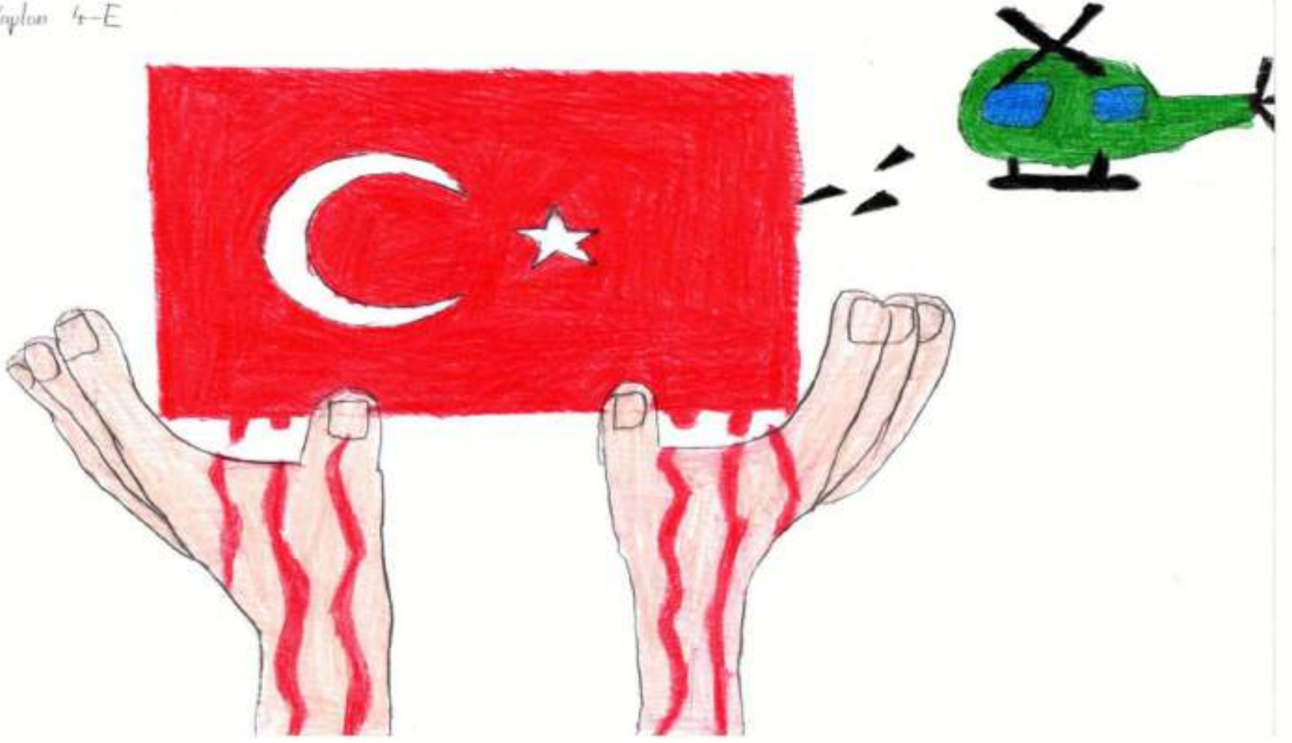
Erva KAPLAN / 4-E Sınıfı